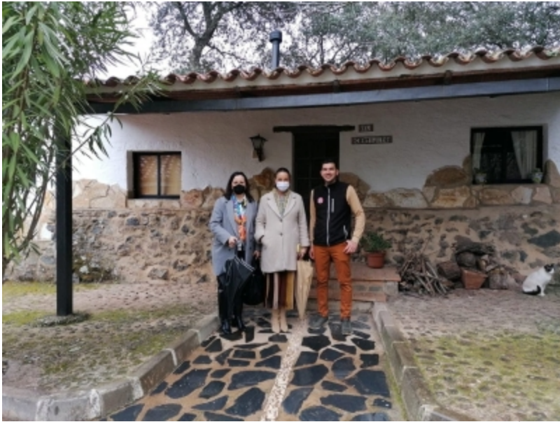
( http://www.cumbresmayores.es/es/.galleries/imagenes-noticias/Noticias-noviembre-2021/visita-delegada-04.jpeg )