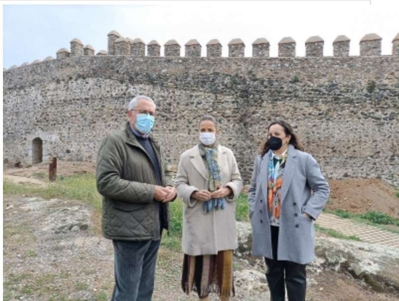
( http://www.cumbresmayores.es/es/.galleries/imagenes-noticias/Noticias-noviembre-2021/visita-delegada-03.jpeg )